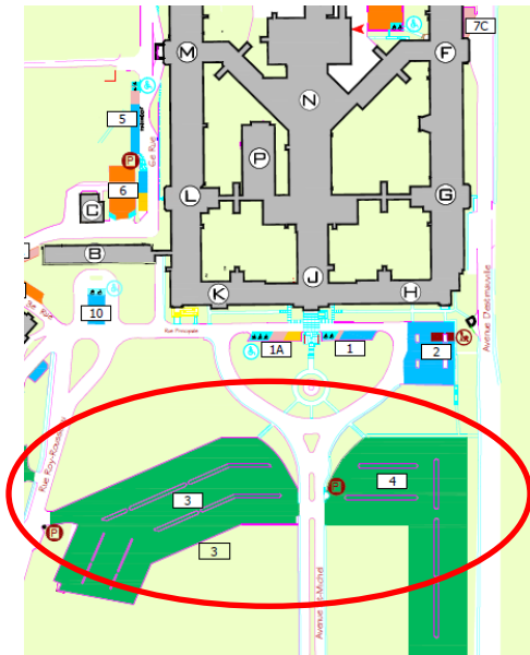
Stationnements 3 et 4